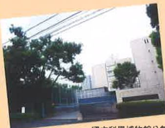
國立科學博物館分館