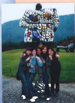
箱根雕刻之森美術館