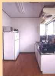
高圓寺寮(女生宿舍)

本校學生的國籍(地區)主要是中国、香港、台湾以及韩国的学生。其他國籍為新加坡、緬甸、越南等亞洲的學生。在本校可以認識各式各樣的朋友、接觸異國的文化，更加深國際交流。