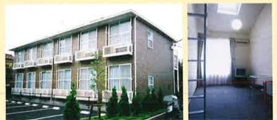
樓上水寮(男生宿舍)