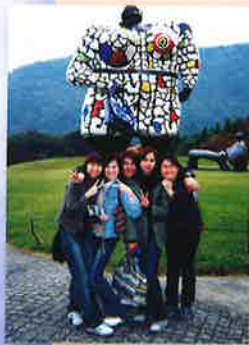
箱根雕刻之森美術館