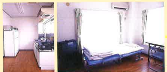
高圓寺寮(女生宿舍)

本校學生的国籍(地区)主要是中国、香港、台湾以及韩国的学生。其他国籍为新加坡、缅甸、越南等亚洲的学生。在本校可以认识各式各样的朋友、接触异国的文化，更加深国际交流。